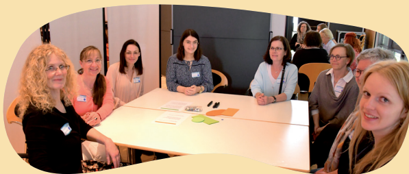
Eine unserer fünf Arbeitsgruppen

Er wies auch darauf hin, dass in den letzten 15 Jahren 148 Personen nach § 218 StGB abgeurteilt wurden. Der Großteil davon Männer, die durch Gewalteinwirkungen einen Schwangerschaftsabbruch herbeiführten. Die Zahl der Abbrüche sinkt seit der Einführung des § 218 weiter – der Kompromiss aus dem Jahr 1995 wirkt.