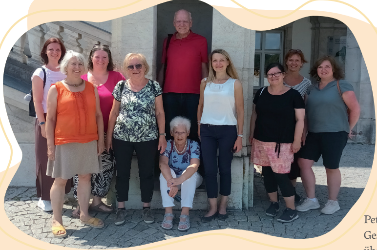
Das Landesteam vor dem Nymphenburger Schloss